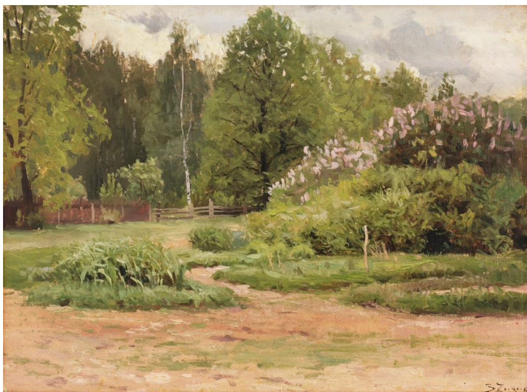
«Сирень в парке», 1930 год, ПМЗ