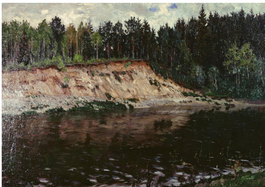
«Река. Обрывистый берег», 1918 год, ПМЗ

Революционные события, происходившие в стране, были встречены Жуковским без энтузиазма. В феврале 1917 года он вступил в члены объединения "Изограф" - организации, объединившей членов Товарищества передвижников, Московского товарищества художников, "Бубнового валета", "Мира искусства", "Союза русских художников" и ряда других. С октября 1918 года С. Ю. Жуковский - член комиссии по охране памятников при ИЗО Наркомпроса. А так же он становится членом художественного совета Третьяковской галереи. По заданию Отдела пластических искусств ИЗО Наркомпроса академик обследовал частные художественные собрания Москвы и Подмосковья и сделал все от него зависящее, чтобы превратить в музей усадьбу Кусково. Но ряд обстоятельств заставляют весной 1918 года художника с супругой покинуть Москву. Они поселились вместе с семьей больного брата в имении Павловское Тверской губернии. Вероятно, картина «Река. Обрывистый берег» (1918 года, ПМЗ) viii была написана именно в этот период, так как она воспроизводит натурный образ местности напротив деревни Поддубье, почти без изменений сохранившийся до настоящего времени.