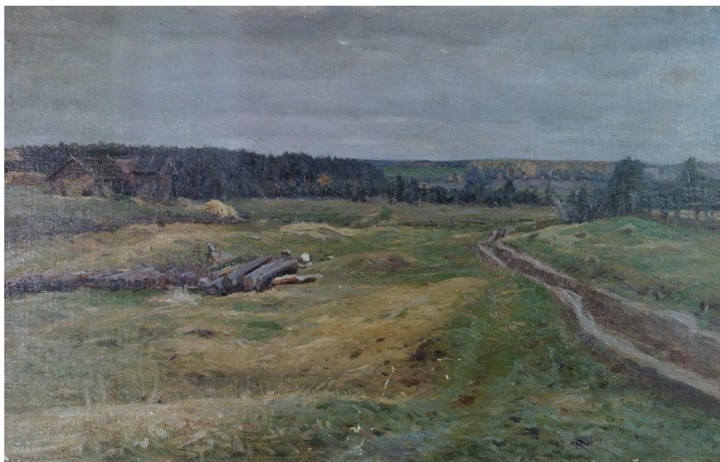
«Пейзаж. Дорога», 1997 год, ПМЗ