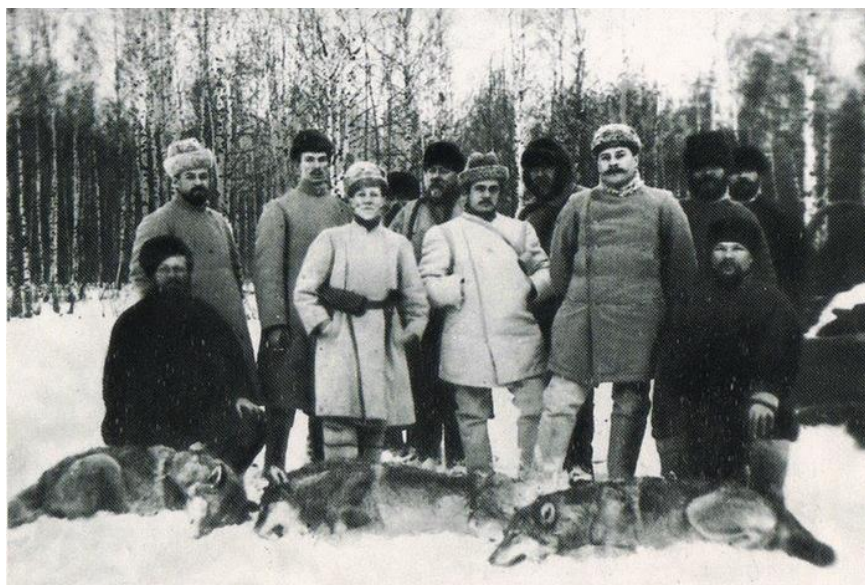
На охоте, 1906 год

В 1915 году семья Жуковских переезжает в новую московскую квартиру (Пречистенский б-р, 25, кв. 8), со вкусом обставленную старинной мебелью, декорированную разнообразными предметами искусства. С. Ю. Жуковский был моден и высоко котиrowался как художник. Было много заказов. Отдыхая, с большим увлечением охотился, в том числе на волков и медведей. iv v