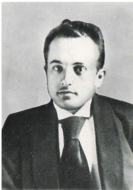
С.Ю. Жуковский, 1892 год

Станислав Юлианович Жуковский родился 13 (25) мая 1873 (1875?) года в польской дворянской семье в Волковысском уезде Гродненской губернии. Его родители оказались там не по своей воли, а в результате санкций, под которые попал его отец за участие в восстании 1863 года. Он был лишен прав состояния и права владения недвижимостью в польских губерниях. Имение Старая Воля, где прошло детство будущего художника, было взято в аренду, его же обитатели значились гродненскими мещанами. Отец, Юлиан Жуковский, был суровым и не слишком культурным человеком, в отличие от матери, получившей образование во Франции. Она рано умерла, оставив троих детей: старшего Болеслава, среднюю Серафиму и младшего Станислава, бывшего на одиннадцать лет моложе брата. В будущем судьбы братьев окажутся тесно связаны: парализованный Болеслав будет находиться под опекой Станислава Юлиановича до самой смерти. По воспоминаниям племянницы С.Ю. Жуковского, да и по его собственным словам, семья жила скудно, прижимисто, безвыездно. Отец Станислава был озабочен выживанием семьи. Требовал он сыновей послушания, прилежной учебы, в наказание заставлял пасти овец, показывая, что ждет их, если они не получают хорошего образования. Судьбу своих сыновей он не связывал с земледелием, вкладывая все свои силы и накопленные деньги в их образование. Отсюда проистекают истоки его сложных взаимоотношений со Станиславом, выбравшего, вопреки воле отца, карьеру художника.