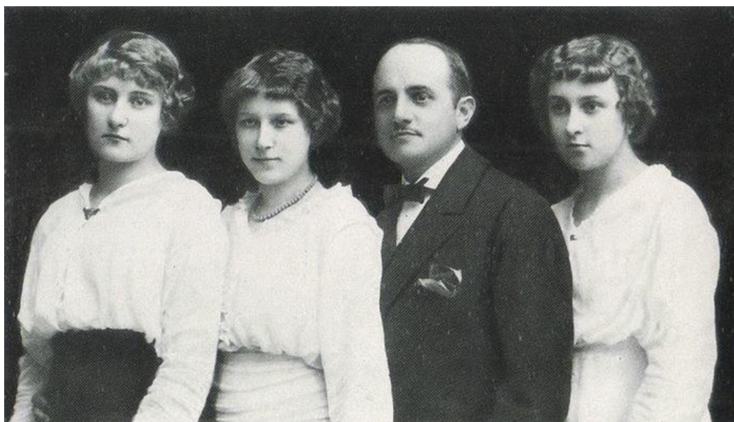
С.Ю. Жуковский с двоюродными сестрами, 1900-е годы

С. Ю. Жуковский, продолжая свое художественное образование, в 1898 году подавал прошение о заграничной командировке, но получил отказ. Он был чрезвычайно трудолюбив, дисциплинирован и целеустремлен. В сочетании с его большим талантом это привело к быстрому успеху, как среди коллег и знатоков, так и у более широкой культурной публики. В 1899 году за картину «Лунная ночь» был удостоен Большой Серебряной медали и звания Классного художника Московского художественного общества. Художник примыкает к поздним передвижникам, но позднее участвует в выставках «Мир искусства» и «Союза русских художников», занимая промежуточное положение между старомодным реализмом одних и откровенным эстетизмом других. iii